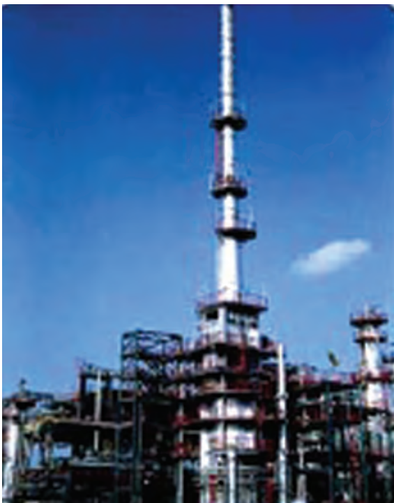
चित्र 5.5 : पेट्रोलियम परिष्करण।

को पृथक करने का प्रक्रम परिष्करण कहलाता है। यह कार्य पेट्रोलियम परिष्करण में सम्पादित किया जाता है (चित्र 5.5)।