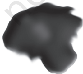
चित्र 5.3 : कोलतार।

यह एक अप्रिय गंध वाला काला गाढ़ा द्रव होता है (चित्र 5.3)। यह लगभग 200 पदार्थों का मिश्रण