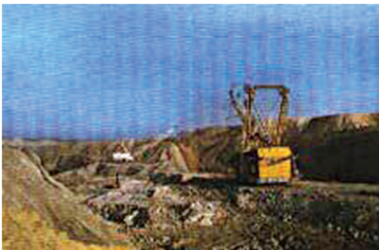
चित्र 5.2 : कोयले की एक खान।

वायु में गर्म करने पर कोयला जलता है और मुख्य रूप से कार्बन डाइऑक्साइड गैस उत्पन्न करता है।