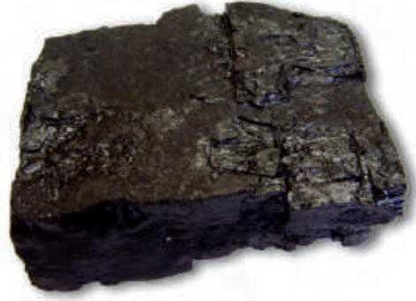
चित्र 5.1 : कोयला।

आपने कोयला देखा होगा या इसके बारे में सुना होगा (चित्र 5.1)। यह पत्थर जैसा कठोर और काले रंग का होता है।